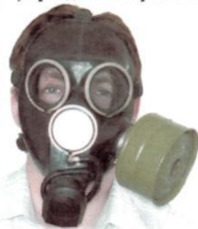
Гражданский противогаз ГП-7В