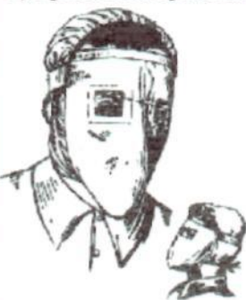
Противопыльная тканевая маска ПТМ-1